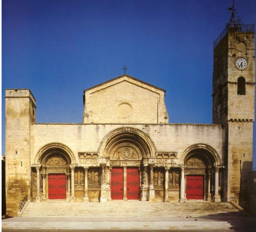
A Saint-Gilles-i bencés apátsági templom