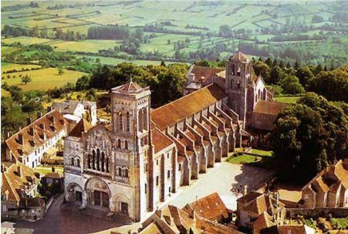
Vézelay, Sainte-Madeleine templom

harmadik templom, amelynek csak csekély része maradt ránk. Ezenkívül számos faragványtöredéket, közöttük figurális díszű oszlopfejeket őriztek meg. Vézelay: Sainte-Madeleine templom . A bencés rendi templom a spanyolországi Compostelába vonuló zarándokok befogadására a XII. század első felében épült. Szentélyét 1200 körül már gótikus stílusban építették újjá.