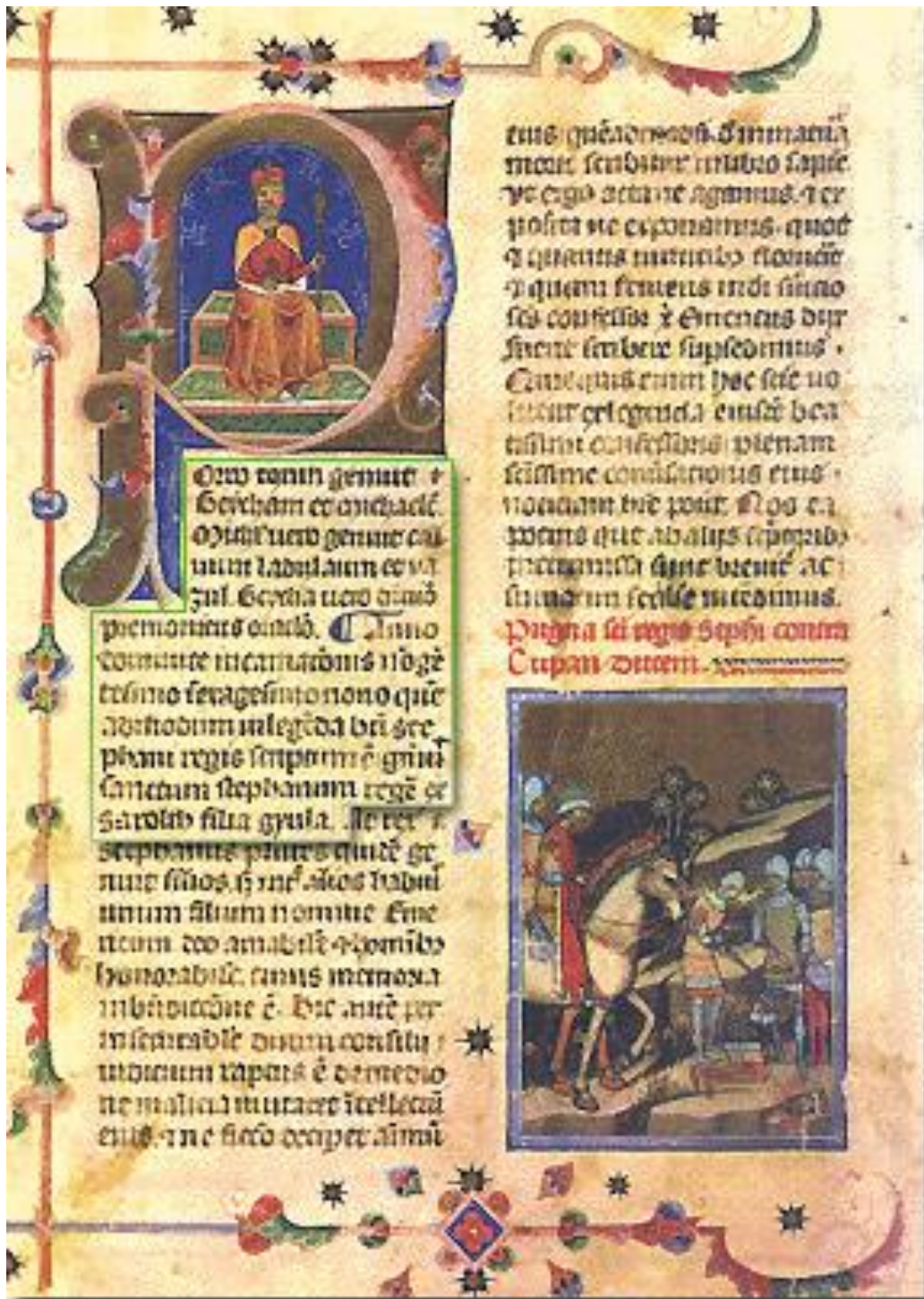
A Gesta Hungarorum részlete